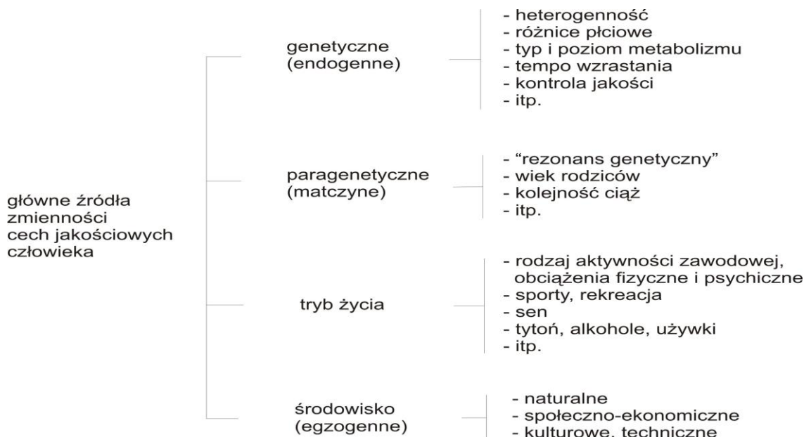
Ryc. 2. Grupy źródeł zmienności, które są równocześnie czynnikami rozwoju człowieka (Wolański, 2006)

ma bezpośrednio związek z grupami czynników endogennych i egzogennych, co przedstawia Ryc.2.